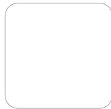
ESPACIO PARA HUELLA

Con la firma del presente documento, declaro que todos los datos consignados son ciertos, que la información que adjunto es veraz y verificable, y que autorizo su verificación ante cualquier persona natural o jurídica, pública o privada, sin limitación alguna, obligándome a actualizar la información y/o a confirmarla cada vez que así sea solicitado. (Si es persona jurídica, firma el representante legal).